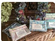
ハンドメイドの作品もあります

カラフルな土台 にインニシャルス タンプを押して、 自分だけのオー ナメントを作り ます！