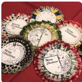
メッセージフレームは多数用意していますが 人気のイラストは早くなくなる可能性があります のでお早めに

クリスマスプレゼントの名札やお部屋の デコレーションなど使い道は色々！作り方 を知っていると様々なシーンで活躍するロ ゼットを作ります。 誰でもすぐできるのでふらっとお立ち寄り ください(*´ω`*) 沢山のマスキングテープとオリジナルイラ ストのメッセージフレームを用意してお待 ちしております！