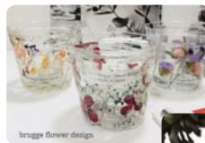
brugga flower design

フラワージェルキャンドル：お好きなプリザー ブドフラワーやドライフラワーを使って、キャ ンドルホルターを作ります。ジェルを通して温 かい灯りをお楽しみいただけます。 アロマワックスバー：プリザーブドフラワーの バラと天然アロマオイルを使った上質なアロマ ワックスバーです。 お好みの香りや花材をお選び頂きます。