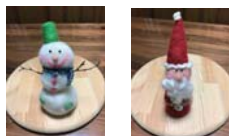
クリスマスの作品もあります