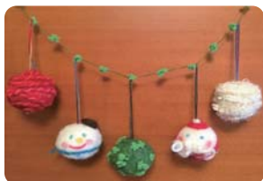
羊毛をチクチクしてオーナメントを作ります

料金：大一個 500円 / 小一個 100円 所要時間：約 20分で完成 定員：先着順 大 10個程度ご用意