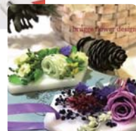
brugga flower design