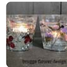
brugga flower design